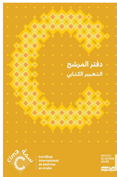
Livret de production écrite