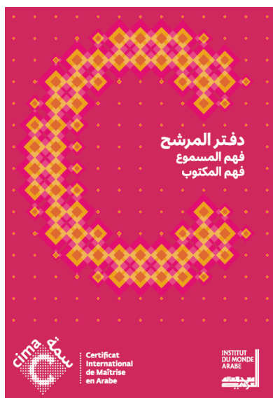
Livret de compréhension orale et compréhension écrite