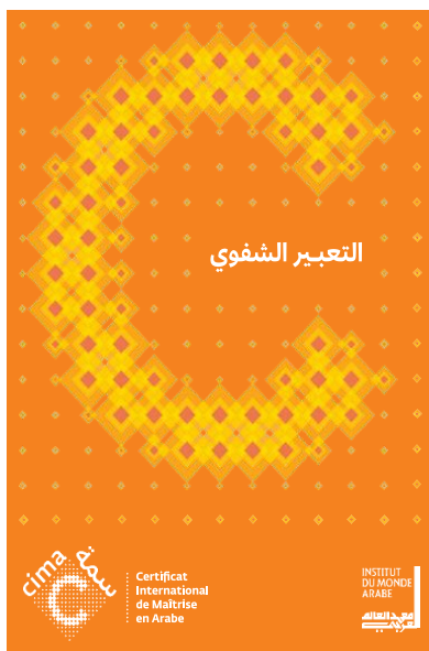
Consignes de production orale