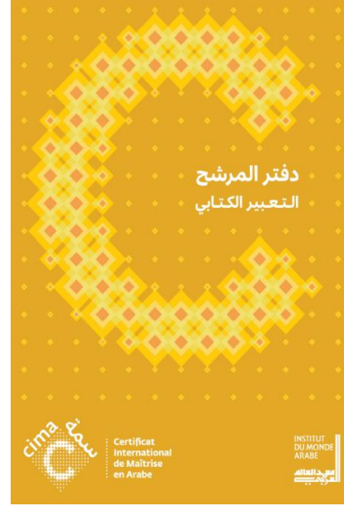
دفتر التعبير الكتابي