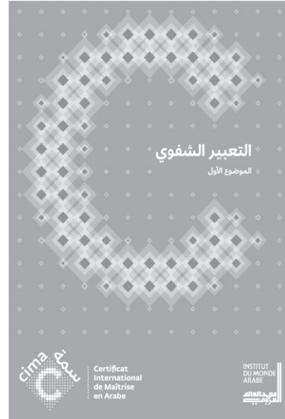
مواضيع التعبير الشفوي