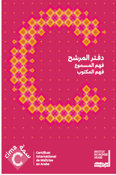
دفتر فهم المسموع وفهم المكتوب