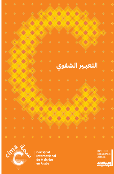
تعليمات التعبير الشفوي